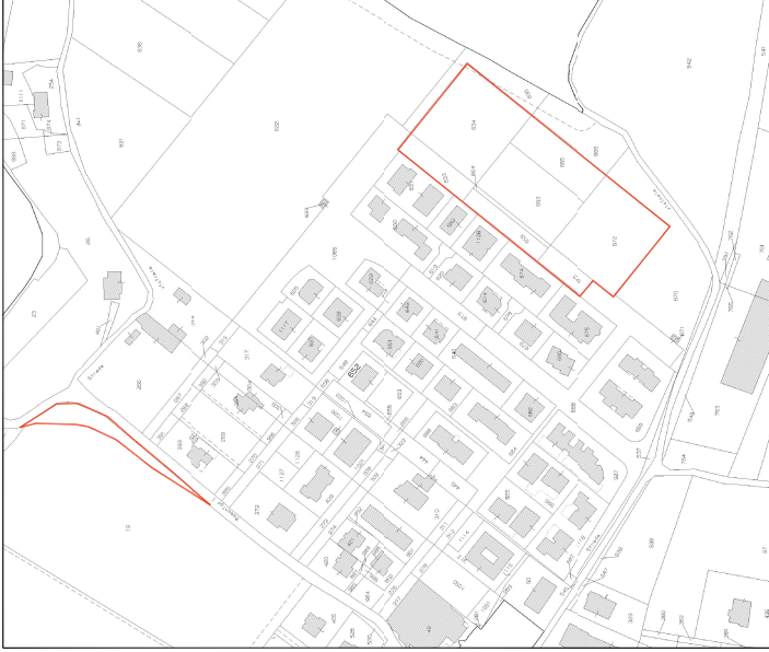
Estratto di mappa scala 1:2000